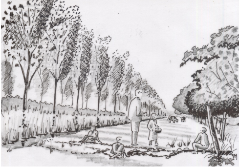
La source sous les renvers, dite "fontaine de Canot".

pouvaient s'abriter ces malheureux hôtes et d'une enceinte, mur ou haie qui les séparait des lieux environnants. La hauteur sur laquelle se trouvait ce refuge, manquait d'eau. Les malades, ses habitants, se rendaient pour s'en procurer, dit la tradition, à la fontaine de Canot , située de l'autre côté de la vallée, au bas des vignobles, par un chemin qui porte encore le nom de sentier des Ladres.