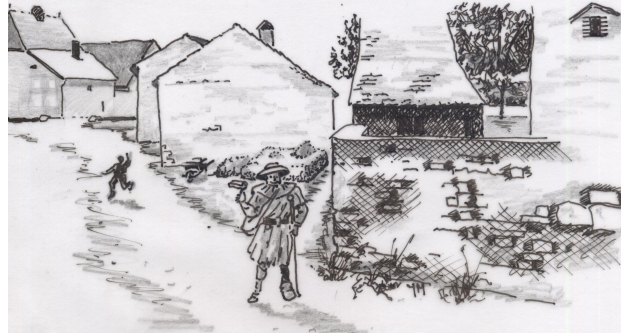
Le sentier des Ladres, au bord de la propriété du Château, au bas de la rue des Prés.

Il serait curieux de savoir au moyen de quelles ressources fonctionnait cet hospice et combien de temps, il resta debout. Il est probable, que lorsque la maladie de la lèpre cessa, les habitations qui devaient être bien modestes, furent abandonnées, et qu'il ne fallut pas longtemps, au milieu des troubles des XIV e et XV e siècles, pour que le tout disparût définitivement. Aussi dans les titres les plus anciens où il est fait mention de la maladière , cette dénomination s'applique à un canton de terre labourable sans qu'il ne soit plus question d'aucune espèce d'enceinte ou de bâtisse quelconque. L'existence de cet établissement que constate le nom du terrain où il était construit et que confirme celui du sentier qui l'avoisine, est, pensons-nous, une preuve nouvelle qu'une église d'une certaine importance existait à proximité, puisque l'administration des maladreries était le plus souvent entre les mains du clergé.